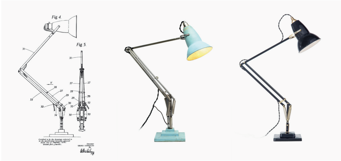
Figura 5: Lámpara Anglepoise